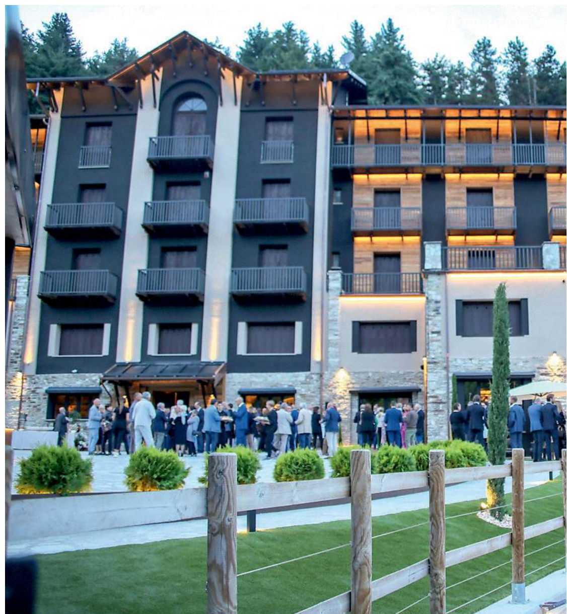
Il Radium Relais di Lurisia ha ospitato ieri l'incontro di Confindustria Cuneo

CON L'ESPERIENZA DEL FESTIVAL CIRCONOMIA