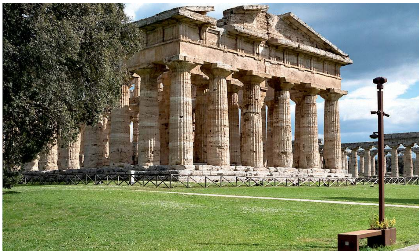
Le isole digitali firmate dalla cuneese Tecno World Group integrate nel Parco archeologico di Paestum

Oggi al Parco archeologico in provincia di Salerno Tecno World Group presenta il suo progetto smart replicabile per la tutela e la valorizzazione dei beni culturali