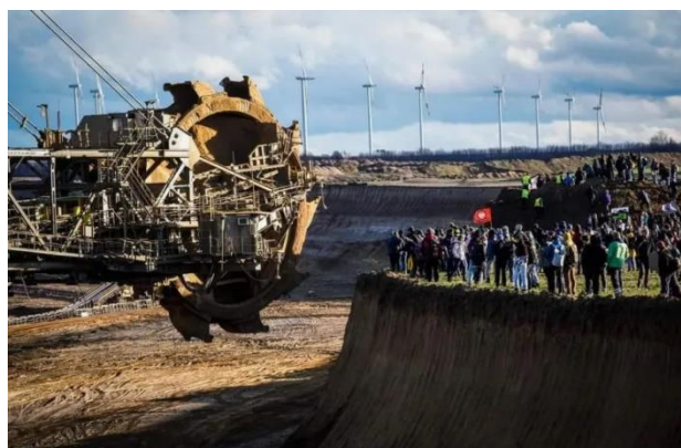
Proteste 2023 Villaggio Lützerath

Nell'ultimo anno è salita alla ribalta delle principali testate la battaglia tra ambientalisti e RWE, la più grande azienda europea nel campo del carbone con 63 milioni di tonnellate estratte solo nel 2022, intenta a demolire il limitrofo villaggio di Lützerath nella Germania Occidentale a favore dell'espansione della sua miniera di lignite, Garzweiler II. Per quanto tale progetto vada a detrimento di tutti gli sforzi legati al contrasto del cambiamento climatico e dei criteri ESG, tra i principali operatori finanziari figurano diverse banche tra cui la stessa Intesa Sanpaolo, che tra gennaio e agosto 2022 ha garantito al colosso tedesco 299 milioni di dollari 25 .